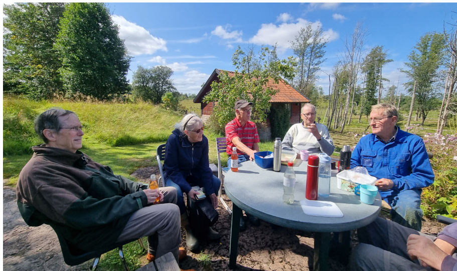
Slättergänget tar en välbehövlig fika vid Skogastorps kvarn den 19 augusti 2024.